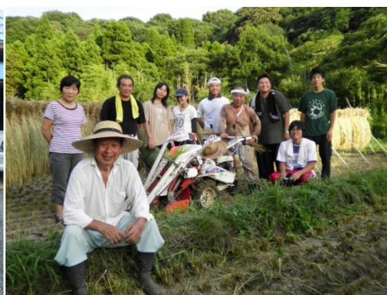
大沢集落と KOOGA の地域づくり活動の様子①