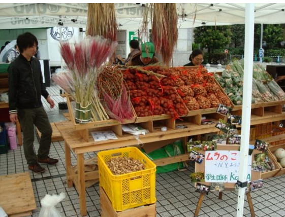
古代米工芸品 (左)、農産物の販売の様子。消費者の声を定期的に生産農家へ伝えた。