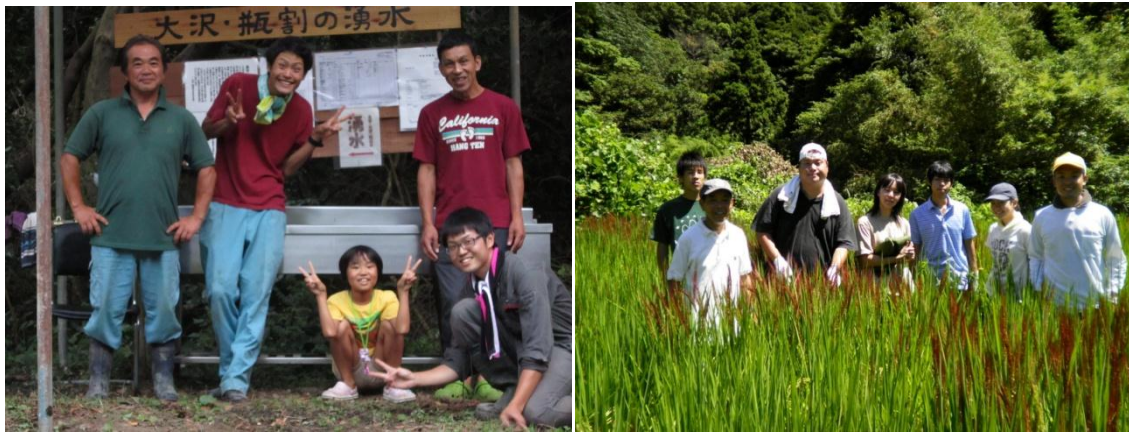
大沢集落と KOOGA の地域づくり活動の様子（右は古代米）②