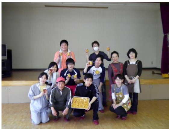
ジャム販売 (右)、地元婦人会とのジャム加工作業の様子 (左)