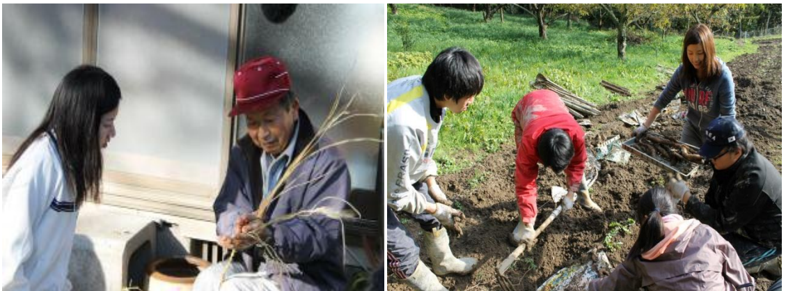
大沢集落と KOOGA の地域づくり活動の様子（農作業体験）③