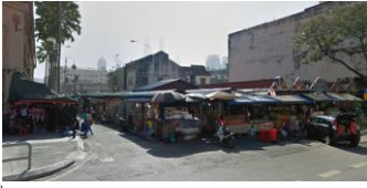
チョーキットの屋台 果物が安く売っている