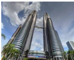
有名なペトロナスツインタワーはここ