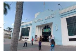
お土産を買うならここ セントラルマーケット