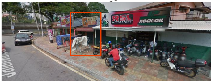
赤枠で囲ってあるお店がランドリー 重さに応じて値段が決まる