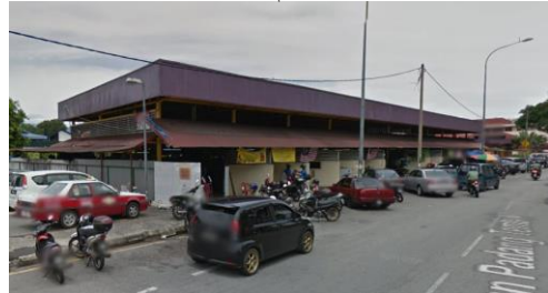
フードコートのような店 店員がランドリー