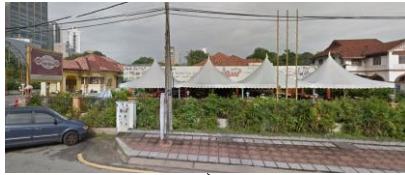
中東料理の出でくるお店、割高だかだけどおいしい