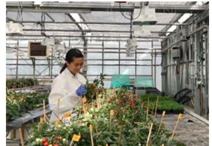
温室にて研究(実験)に没頭

2017年1月に渡仏してから6ヶ月間は、研究活動が中心の生活でした。昼はフランス国立農学研究所ボルドー研究センター（INRA-Bordeaux-Aquitaine）にて実験やディスカッションを行い、夜と週末には関連研究の論文を読んだり総説論文の執筆していました。遊びや飲み会に誘われることも無ければ、学会参加等のイベントもなく、週2回のセミナーを除いては四六時中自由に時間を使えた為、存分に研究に集中することができました。その結果、思うように実験が進まない時の忍耐力やトラブルシューティングの方法を身につけることができました。英語でのディスカッションは、伝え方の試行錯誤を繰り返しながらも、自然と行えるようになりました。