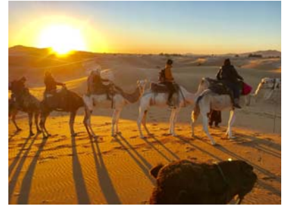
クリスマスのモロッコの朝

ボルドー滞在期間を通じて、フランス国内外の文化に触れる機会が多くありました。留学前は想像もつかなかった異文化の空気感に呑まれた時には、大きな動揺と感動がありました。例えば、革命記念日のフランスや、独立に向けた住民投票日のバルセロナ、クリスマスのモロッコ等に居合わせることができましたが、そこには私の想像を遥かに超える光景が目の前に広がっていました。様々な文化に触れたことで、多様な考え方や生き方を受け入れられるようになったと感じました。